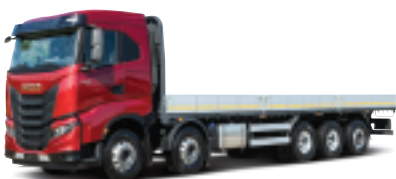
570마력 10X4 카고트럭