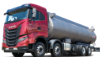
570마력 8X4 새시 : 탱크로리