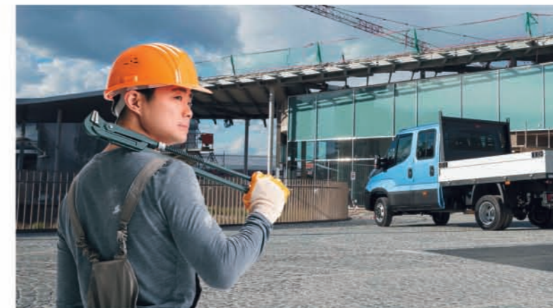
트럭의 DNA를 그대로 이어받은 데일리는 중량물 운송에도 적합하도록 설계되어 다양한 용도로 활용 가능합니다.

뉴 데일리 유로 6는 다른 상용차가 넘볼 수 없는 적재 능력을 갖추고 있으며, 어떤 차량보다 더 오랫동안 고성능의 가치를 유지할 수 있도록 제조되었습니다. 언제나 최적의 속도로 작동하는 신뢰할 수 있는 엔진 및 변속기와 함께 드라이브 라인은 긴 수명과 최적의 성능을 끝까지 발휘합니다. C-섹션 프로필과 고강도 강철로 제작된 새시는 차량의 수명 동안 내구성이 유지됩니다. 뉴 데일리 유로 6는 일 년 365일 최고의 성능을 발휘, 고객의 가치를 지속적으로 실현합니다.