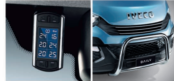
타이어 공기압 모니터링 시스템

최신 기능과 기술이 적용된 다양한 모바일 워크 스테이션이 있습니다. 'Full Vision' 멀티미디어 시스템은 내비게이션, 후방 카메라로 구성되어 있어 완벽한 멀티미디어 내비게이션과 후진 시 안전을 확보할 수 있습니다. 스마트 드라이빙 보조 시스템은 GPS 내비게이션 시스템과 충돌 사고 시를 대비하기 위한 고해상도 디지털카메라로 구성되어 있습니다. 계속해서 인터넷에 접속을 유지하려면 10개의 와이파이 기기를 동시에 지원하는 3G 와이파이 라우터를 고려해볼 수 있습니다.