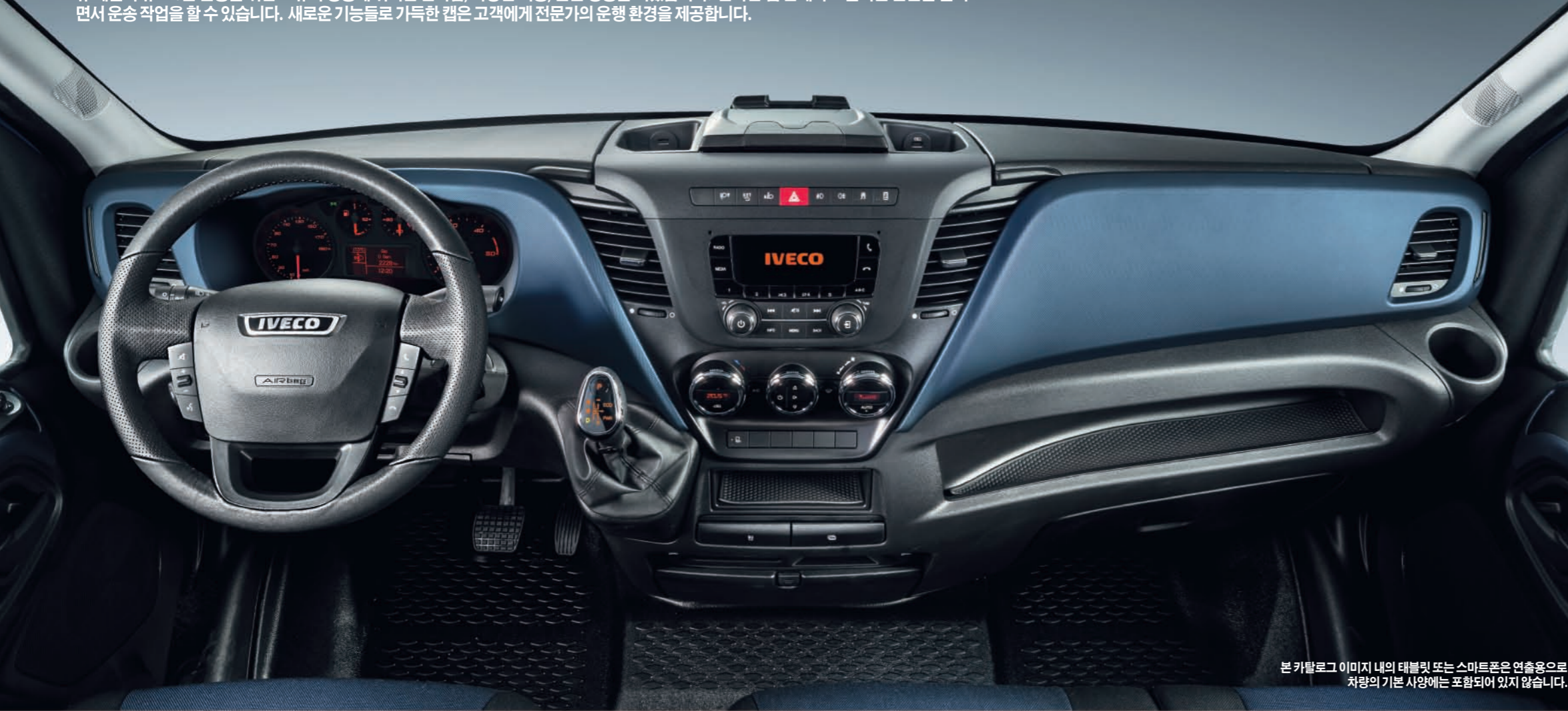
본 카탈로그 이미지 내의 태블릿 또는 스마트폰은 연출용으로 차량의 기본 사양에는 포함되어 있지 않습니다.

뉴 데일리 유로 6는 운송을 위한 고유의 성능에 뛰어난 안락함, 다양한 기능, 운전 성능을 더했습니다. 안락한 캡 안에서 효율적인 운전을 즐기면서 운송 작업을 할 수 있습니다. 새로운 기능들로 가득한 캡은 고객에게 전문가의 운행 환경을 제공합니다.