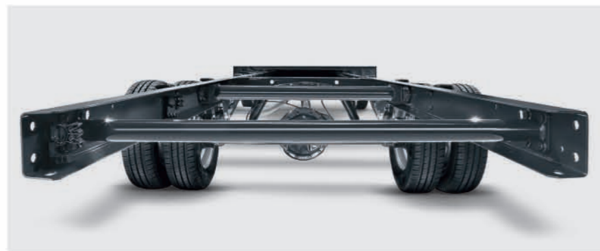
고정력 프레임과 강력한 서스펜션을 적용하였습니다.

한편, 7t 및 7.2t 복륵 모델에 적용된 쿼드-토르 서스펜션은 최대 2,700kg의 하중을 견딜 수 있습니다. 더 많은 화물을 적재할 수 있는 뉴 데일리 유로 6는 더 적은 운행으로도 더 빠르게 운송작업을 마칠 수 있어 운용 비용을 절감하고 이산화탄소 배출도 줄일 수 있습니다.