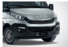
50115 - 마기러스 그레이