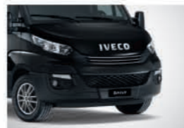
52360 - 올 블랙