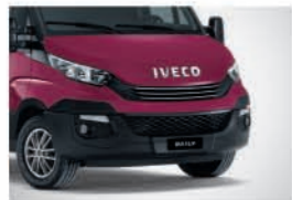
50124 - 메탈릭 레드