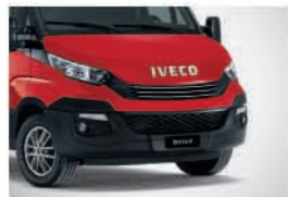
50126 - 마라넬로 레드