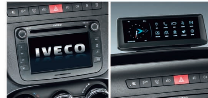
멀티미디어 시스템 (Full Vision)

뛰어난 공기 역학적 솔루션인 오리지널 루프 스포일러는 연료의 소모를 줄여주기 때문에 뉴 데일리 유로 6의 효율성을 높여줍니다. 선바이저는 태양 광선의 자극을 줄여주고 겨울철 윈드실드에 성애가 생성되는 것을 방지합니다. 시야를 방해하지 않으면서도 공기역학적 저항과 흔들림을 줄여주는 디플렉터도 차량의 성능을 높입니다.