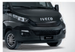
52358 - 스톤 그레이