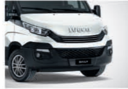
50105 - 폴라 화이트