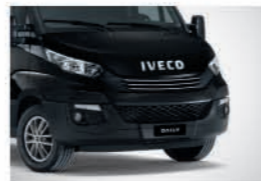
52062 - 블랙