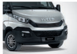
52205 - 브릴리언트 그레이