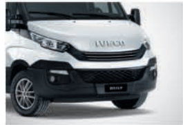
50135 - 비즈니스 화이트