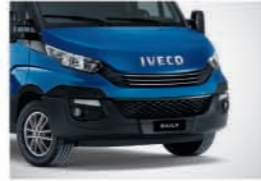
50120 - 페가수스 블루