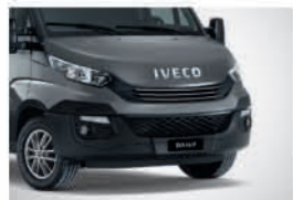
50127 - 올름 그레이