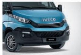
52490 - 인스티트 블루