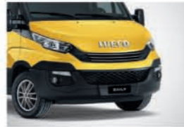
52170 - 선 옐로우