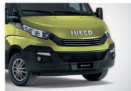
52434 - 에코 그린