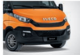
52028 - 어드벤처 오렌지