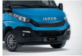
50051 - 라이트 블루