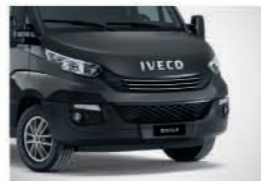
50162 - 프로페셔널 그레이