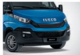
52481 - 보레알 블루