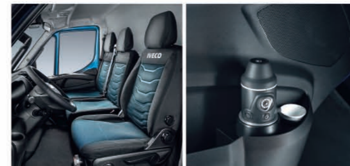
시트 커버 & 매트

안전한 운전을 위해 다양한 액세서리를 선택하십시오. 타이어 공기압 모니터링 시스템은 적정 타이어 공기압을 확인할 수 있도록 함으로써 연비 관리에 도움을 줍니다. 주차 센서는 차량의 조작을 쉽게 합니다. 유럽 인증의 푸시바는 차량의 전면을 보호할 뿐만 아니라 차량과 보행자에 대한 능동적, 수동적 보호를 제공합니다. 차량과 적재함을 보호할 수 있는 드릴 방지 및 물품 도난 방지 록과 전자 및 기계적 보호를 위한 차량 도난 방지 장치도 있습니다.