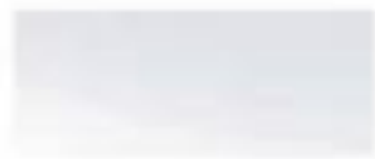
52507 - 冰雪白