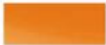
52028 - 冒险橙