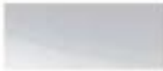
52205 - 灿灰