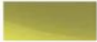
52434 - 生态绿