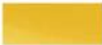
52170 - 日光黄