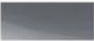
50127 - 乌尔姆灰