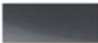
50162 - 专业灰