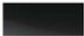
52062 - 纯黑