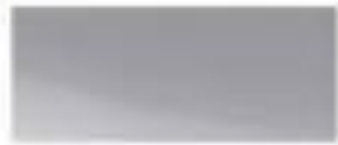
50116 - 铂金灰