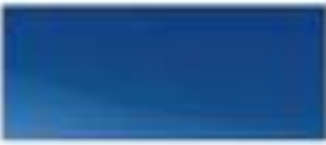
52481 - 北极光蓝