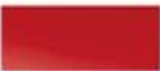
50126 - 马拉内罗红