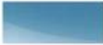
52490 - 直觉蓝