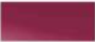
50124 - 金属红