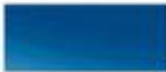
50120 - 毕加索蓝