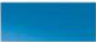
50051 - 淡蓝