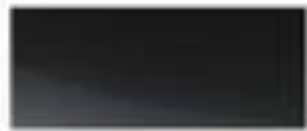
52360 - 冠军黑