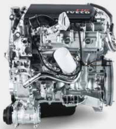
3.0升 F1C 柴油发动机 (带 SCR)