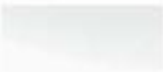
50105 - 极地白