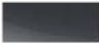
52358 - 岩石灰