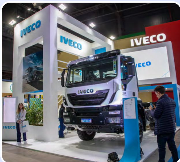
Volvimos a AOG en La Rural