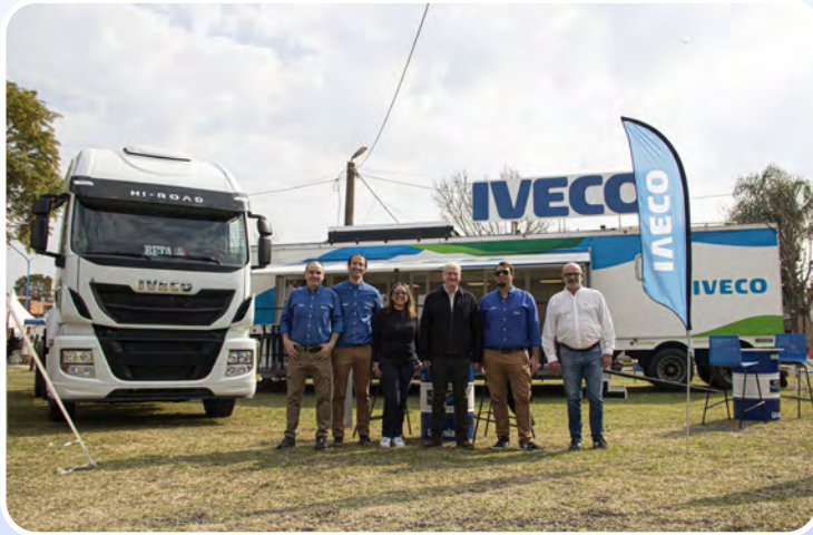
Nuestro stand junto a BETA en la tradicional Fiesta del Transporte de Pujato