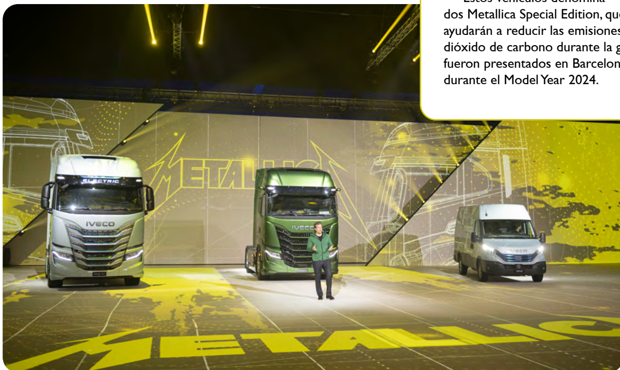
Gerrit Marx, CEO de IVECO, en la presentación de Metallica Special Edition

Estos vehículos denomina- dos Metallica Special Edition, que ayudarán a reducir las emisiones de dióxido de carbono durante la gira, fueron presentados en Barcelona durante el Model Year 2024.