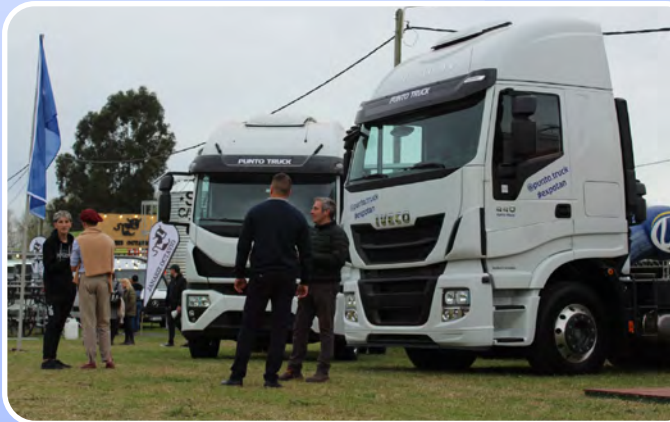
Daily, Tector y Stralis fueron los modelos exhibidos en ExpoTan