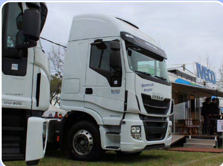
Las sierras de Tandil fueron testigos de ExpoTan