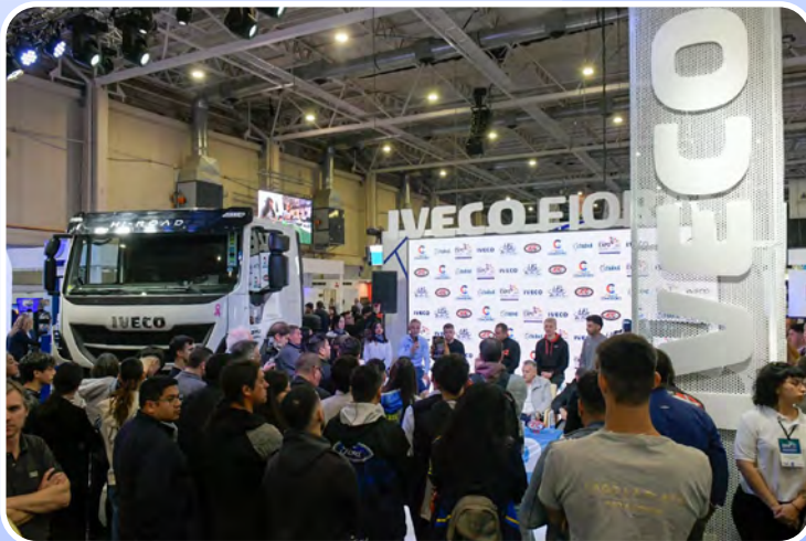
Presentamos una nueva fecha de TC Pick Up en la Expo Industrial y Comercial de Comodoro