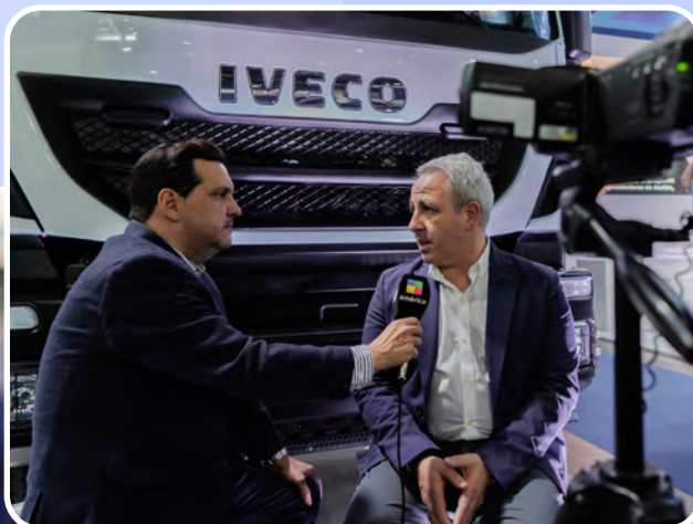
Además, recibimos la visita de medios de comunicación especializados