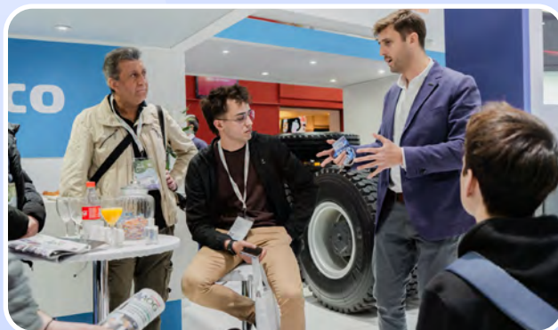
Estudiantes de Ingeniería de la UADE visitaron el stand en AOG y charlaron con nosotros