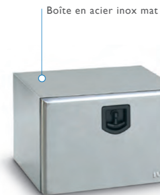
Boîte en acier inox mat

Réalisée en polyéthylène de moyenne densité, elle possède un système exclusif de fermeture à levier à double cran, nouvellement conçu, et un dispositif magnétique de prévention « M.L.D. » contre les ouvertures accidentelles. Elle est fournie avec une clé et un cache pour la serrure.