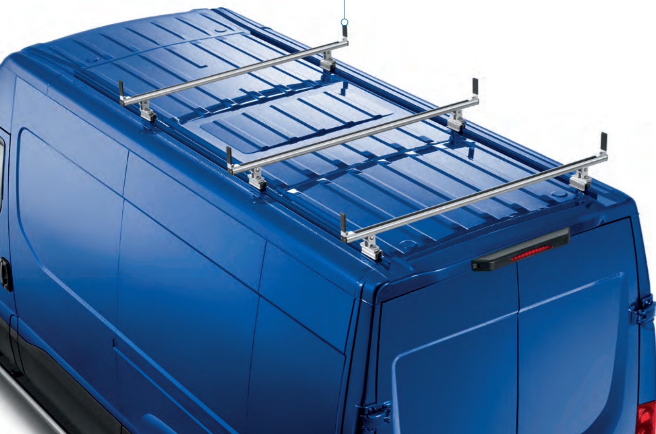
Kit 3 barres porte-tout