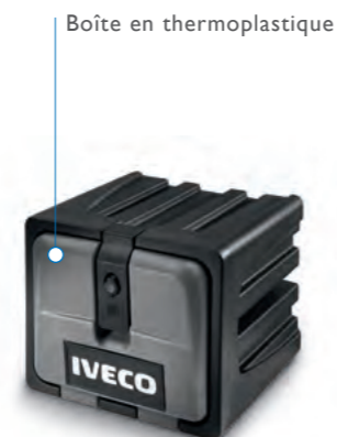
Boîte en thermoplastique