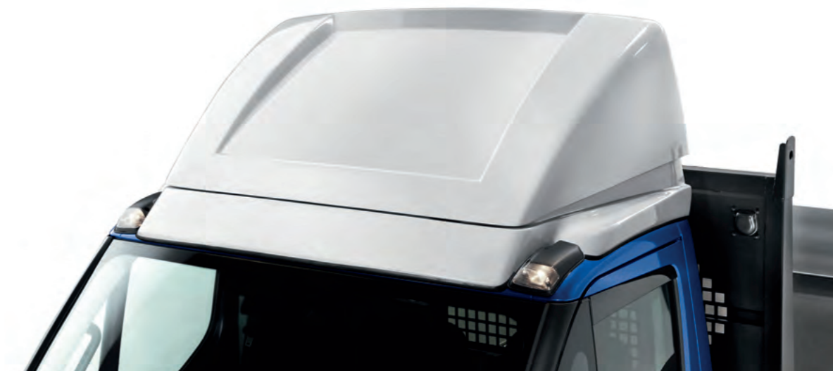
Spoiler ligne standard