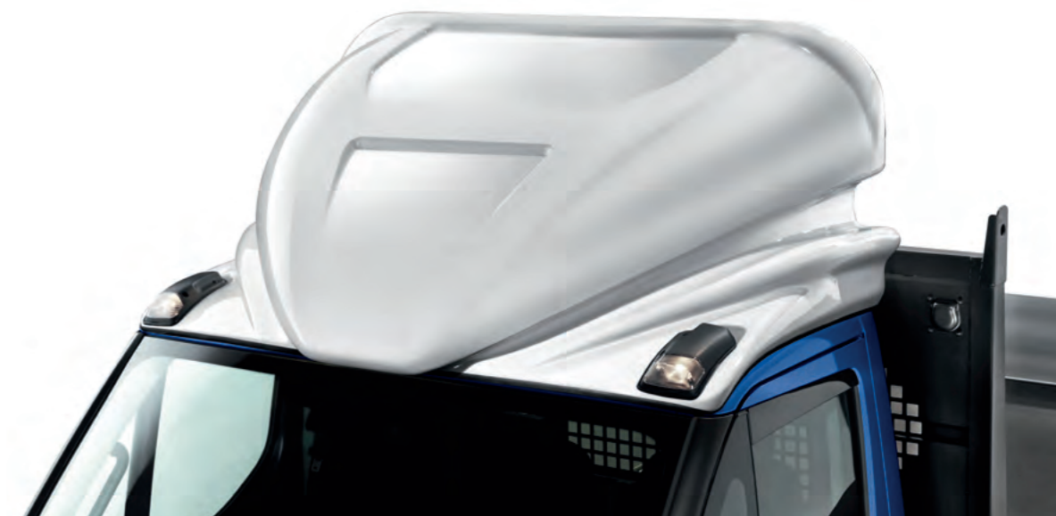
Spoiler ligne sport